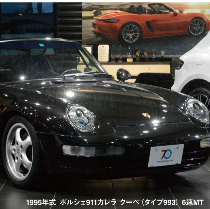
1995年式 ポルシェ911カレラ クーペ (タイプ993) 6速MT