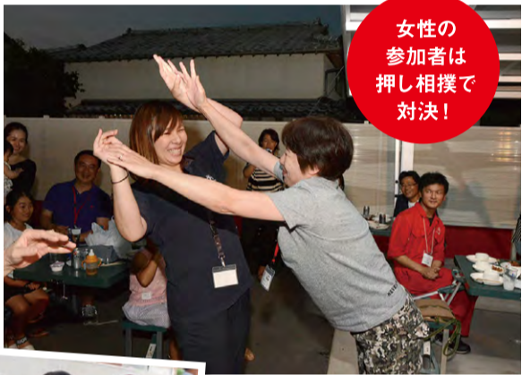
女性の参加者は押し相撲で対決!