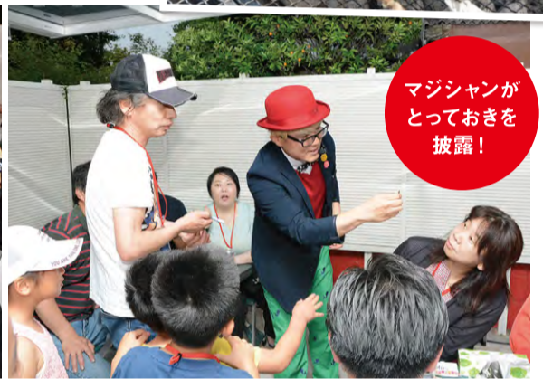
マジシャンがとっておきを披露!