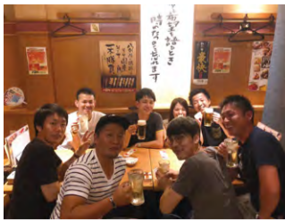
左は、若かりし日の野球仲間との写真。それが年月を経て全員いい歳をとり、お酒と一緒に飲む間柄に。野球部の仲間との飲み会は、恒例行事になっています