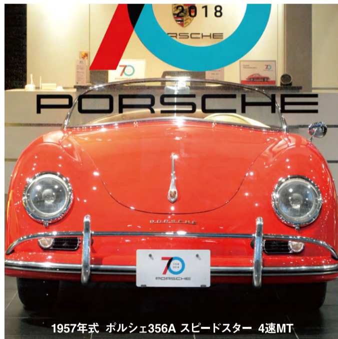
1957年式 ポルシェ356A スピードスター 4速MT