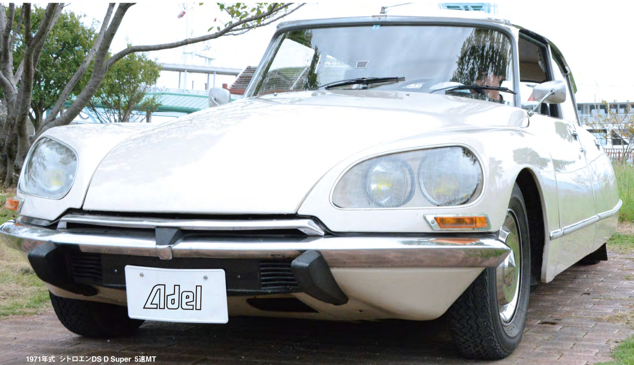
1971年式 シトロエンDS D Super 5速MT

This tabloid paper is intended to encourage people working at Adelpcars to look at their daily lives and people, to motivate them and make them more attractive.