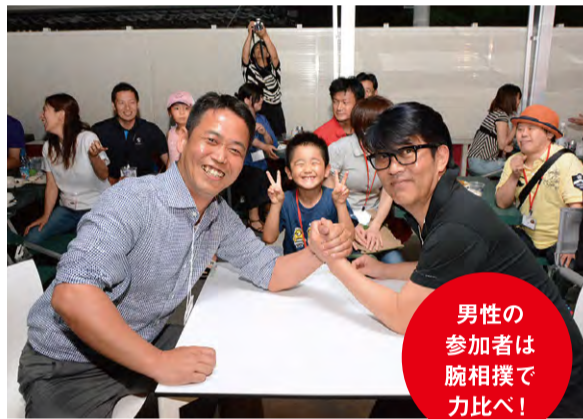
男性の参加者は腕相撲で力比べ!