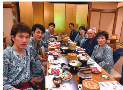
「仕事面では全員違った道を歩んでいる3人兄弟ですが仲はいいですよ」。毎年の恒例となっている家族旅行の時のひとコマ