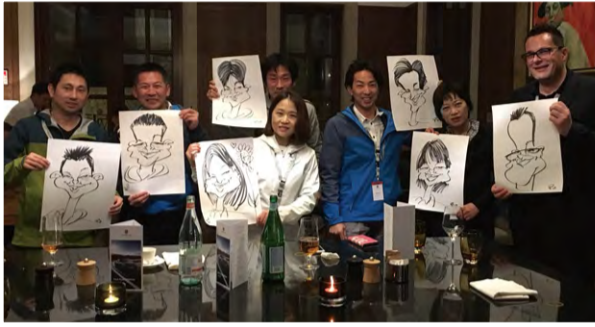
イラストレーターがテーブル全員の似顔絵を描いてくれました