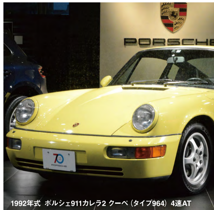
1992年式 ポルシェ911カレラ2 クーペ (タイプ964) 4速AT